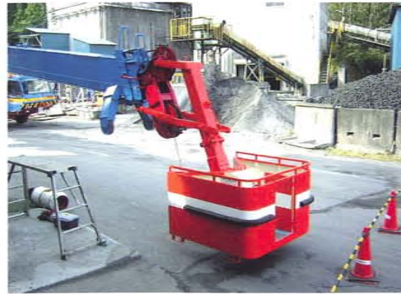
200T フルオートジブ取付

ボックスの外側は鋼板で囲い、高所においての搭乗者の風よけと恐怖心を少なくしています