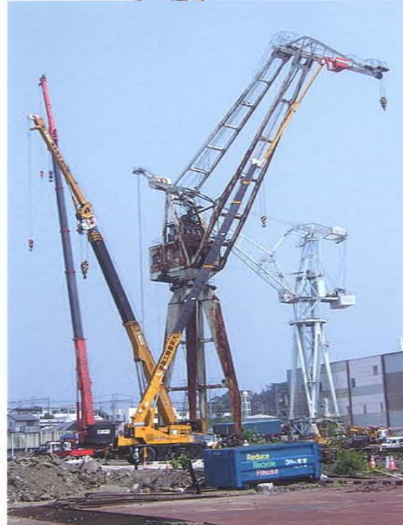
造船所クレーン解体 50m作業 50Tラフター