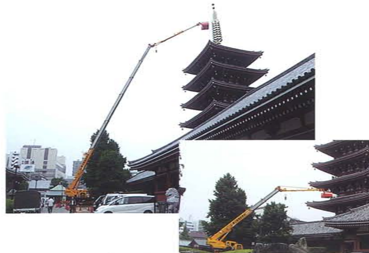
五重塔メンテナンス 50m作業 60Tラフター