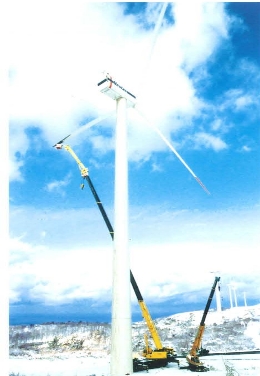
200Tフルオートジブ装着