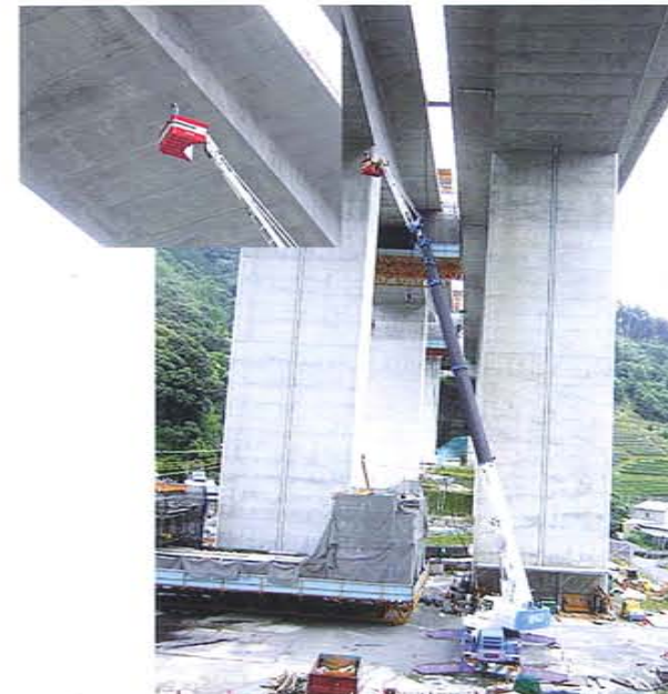
高速道 橋桁点検 40m作業 50Tラフター