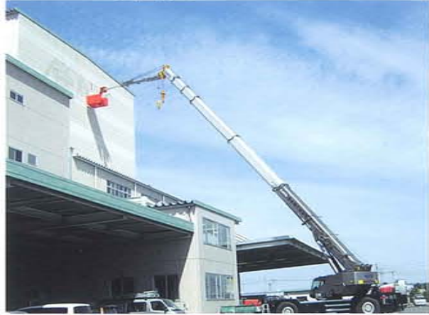
倉庫看板作業 半径30m 50Tラフター