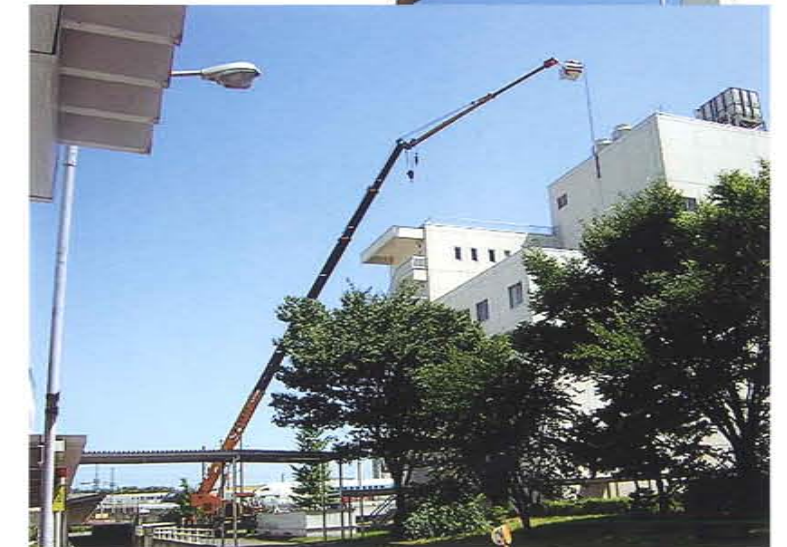
ビル避雷針交換 半径30m作業 50Tラフター