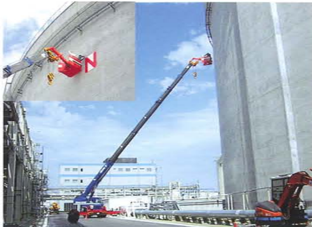
LNGタンク看板作業 半径25m 50Tラフター