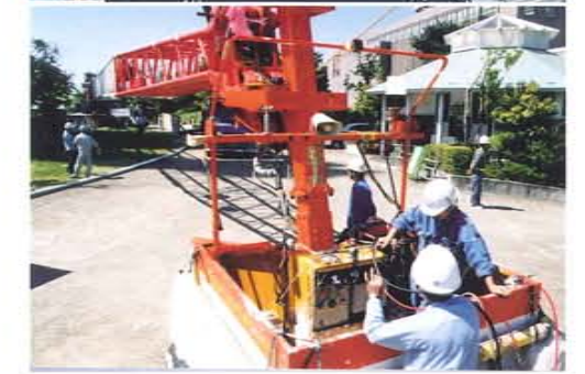
100m観音像リニューアル 100m作業 300Tクレーン