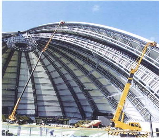
ドーム塗装 55m作業 50Tラフター