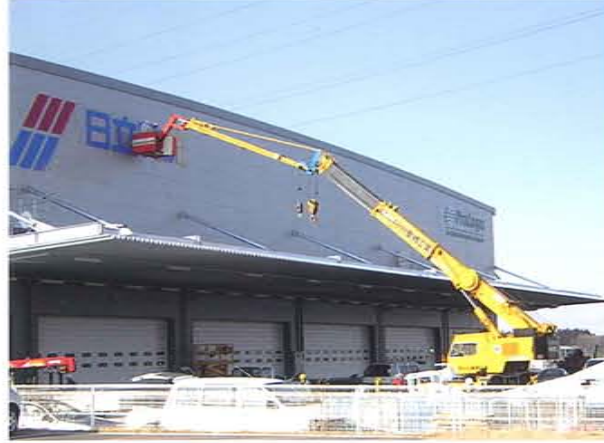
倉庫看板作業 半径20m 25Tラフター